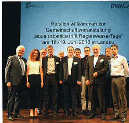
Die Veranstalter der Gemeinschaftstagung