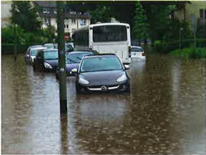
Starkregenüberflutungen – ein allzu häufiges Bild in diesem Frühsommer

tungen – werden bislang eher sporadisch und stark vereinfacht vorgenommen.