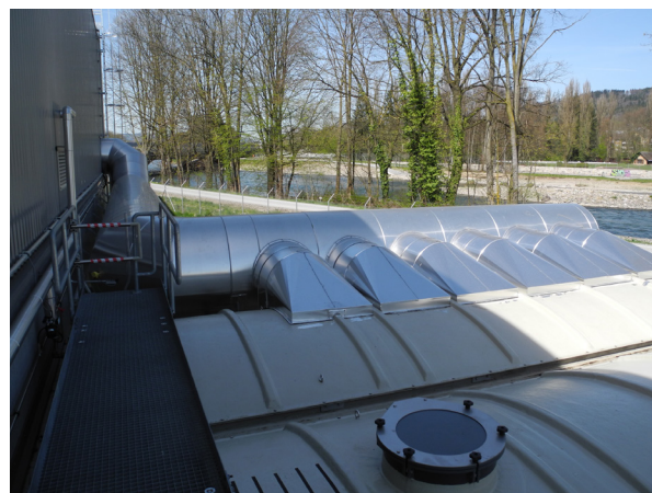
Betrieb mit verschiedenen Abluftkanälen

Für eine allgemein verbindliche Festlegung von Emissionsgrenzwerten für Gerüche fehlen klar definierte gesetzlichen Grundlagen. Anhand der Geruchsempfehlung des BAFU (Zurzeit als Entwurf vom Jahr 2015 vorhanden) können Emissionen von geruchsaktiven Stoffen aufgrund von olfaktometrischen Messungen und der Distanz zu naheliegenden Wohngebieten beurteilt werden. Diese Beurteilung gibt Auskunft darüber, ob mit einer Belästigung der Anwohner zu rechnen ist oder nicht. Im konkreten Fall kann die Festlegung eines Geruchsgrenzwertes im gegenseitigen Einvernehmen zwischen Verursachern, Anwohnern und Behörden sinnvoll sein. Das UMTEC hilft Ihnen dabei.