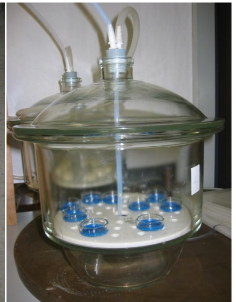
Baumaterialien beim Ausgasen