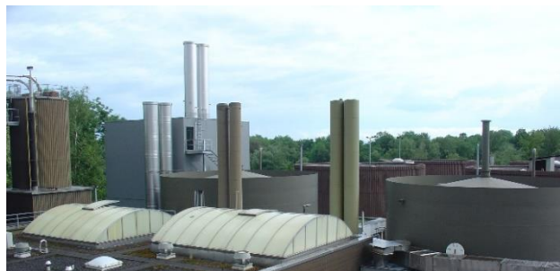
Abbildung 2: Betrieb mit verschiedenen Abluftkanälen

Für eine allgemein verbindliche Festlegung von Emissionsgrenzwerten für Gerüche fehlen klar definierte gesetzlichen Grundlagen. Anhand der Geruchsempfehlung des BAFU (Zurzeit als Entwurf vom Jahr 2015 vorhanden) können Emissionen von geruchsaktiven Stoffen aufgrund von olfaktometrischen Messungen und der Distanz zu naheliegenden Wohngebieten beurteilt werden. Diese Beurteilung gibt Auskunft darüber, ob mit einer Belästigung der Anwohner zu rechnen ist oder nicht. Im konkreten Fall kann die Festlegung eines Geruchsgrenzwertes im gegenseitigen Einvernehmen zwischen Verursachern, Anwohnern und Behörden sinnvoll sein. Das UMTEC hilft Ihnen dabei.